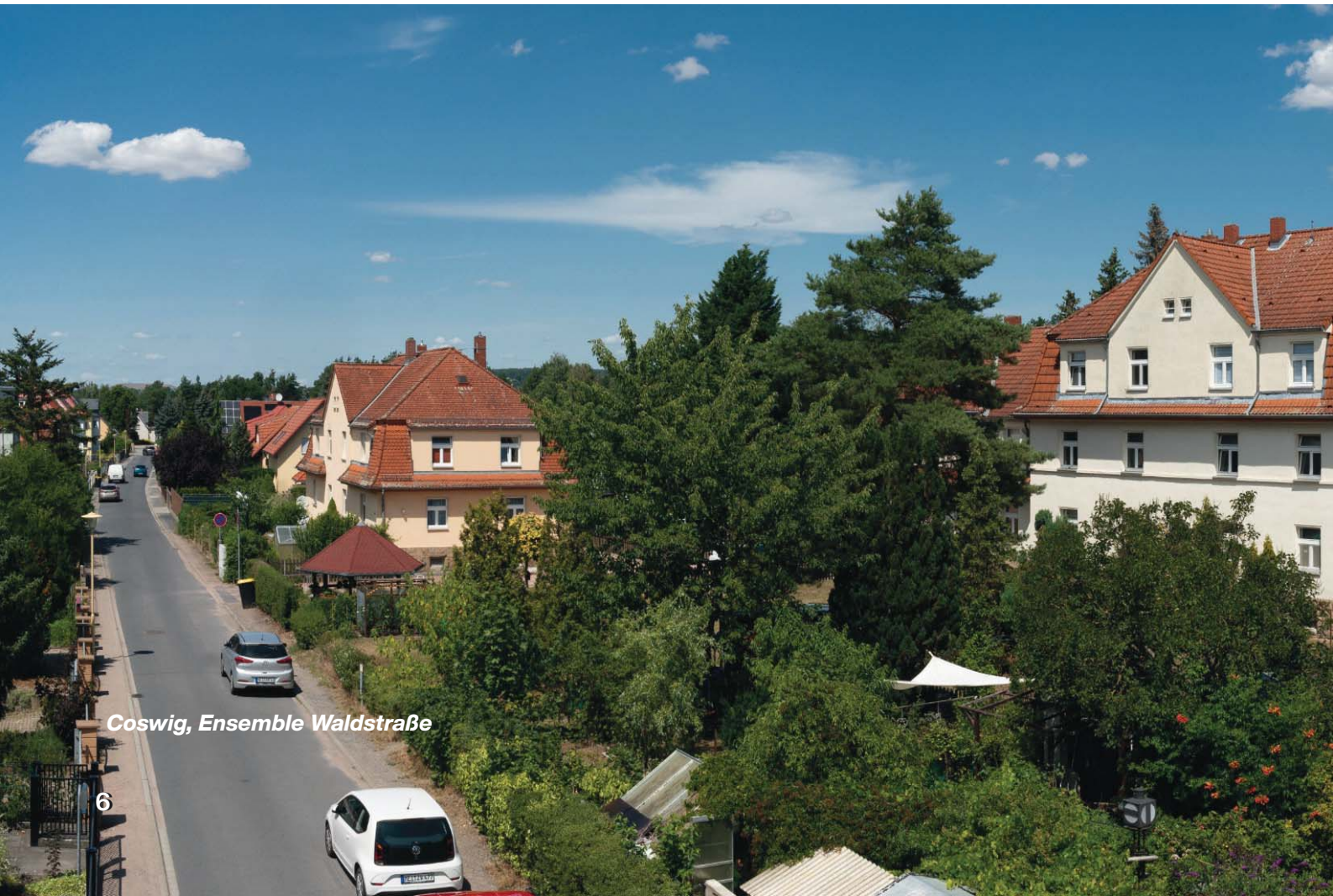
Coswig, Ensemble Waldstraße