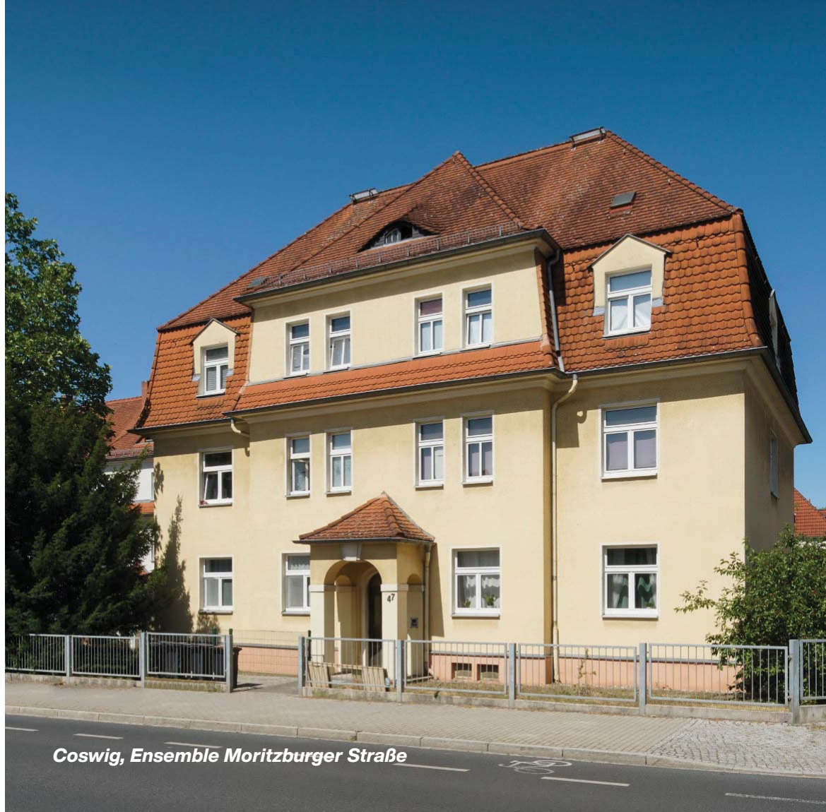
Coswig, Ensemble Moritzburger Straße