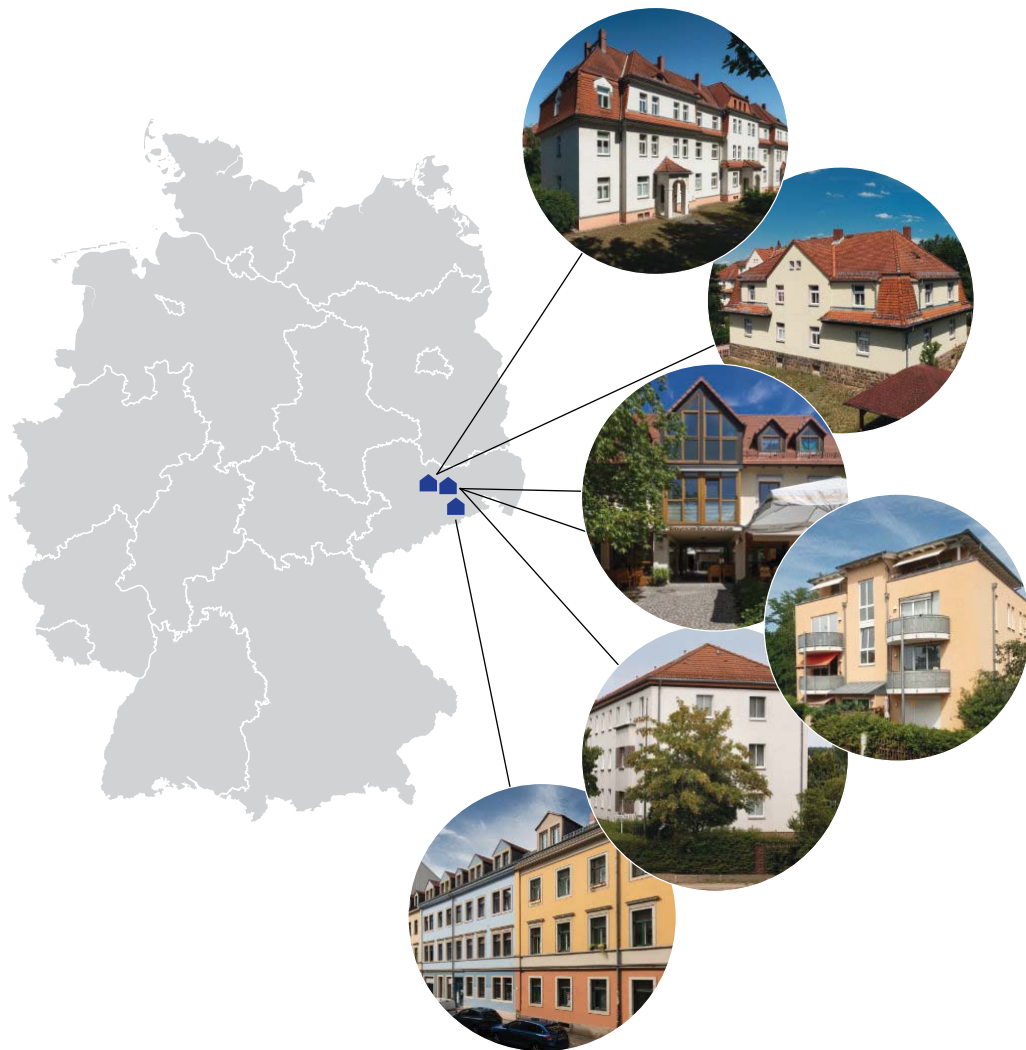
Die 6 Standorte der Objekte des Startportfolios in Dresden, Coswig und Radebeul