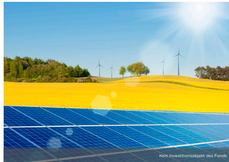
Kein Investitionsobjekt des Fonds