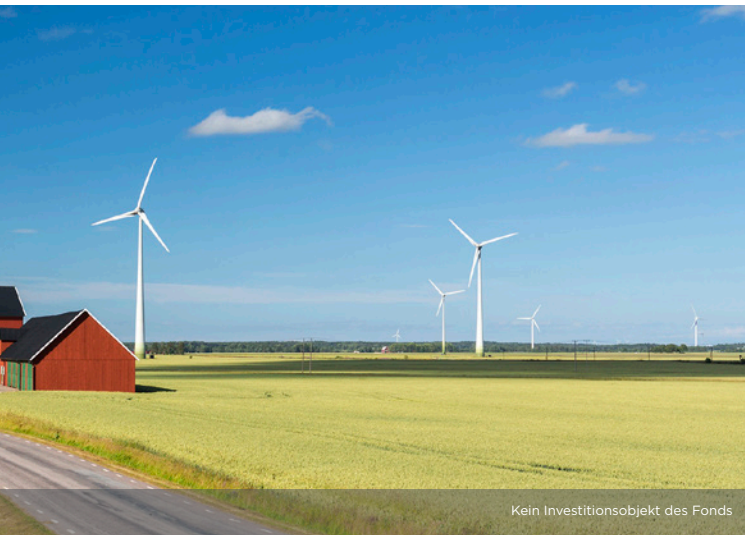
Kein Investitionsobjekt des Fonds

Insgesamt wurden durch Wind- und Solarparks der EURAMCO Gruppe rund 3 Millionen MWh Strom erzeugt und 1,6 Millionen Tonnen CO 2 -Emissionen vermieden: