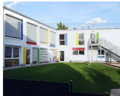
KITA KÖLN III

Nettonutzfläche.....908 m 2 Besp. Außenfläche.....883 m 2 Kita-Plätze.....80 Volumen.....ca. 3,4 Mio. € Fertigstellung.....2015