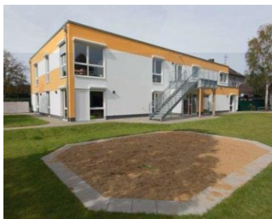
KITA KÖLN I

Nettonutzfläche.....532 m 2 Besp. Außenfläche.....883 m 2 Kita-Plätze.....50 Volumen.....ca. 2,1 Mio. € Fertigstellung.....2014