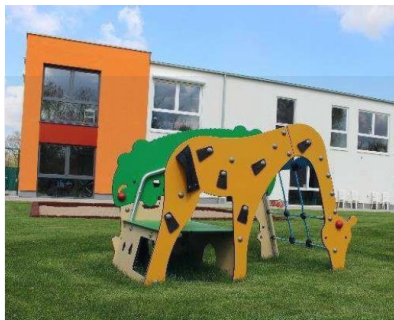
KITA KÖLN II

Nettonutzfläche.....532 m 2 Besp. Außenfläche.....883 m 2 Kita-Plätze.....50 Volumen.....ca. 2,1 Mio. € Fertigstellung.....2014