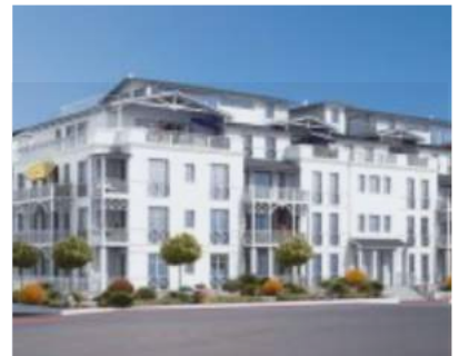
BINZ - HOTEL

Projektart.....Neubau Wohneinheiten.....7 WE Fertigstellung.....2018 Volumen.....ca. 2,95 Mio. €