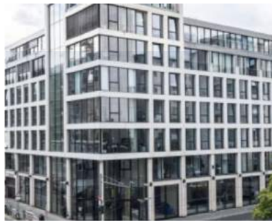
BERLIN - GEWERBE

Projektart.....Sanierung Zimmer.....115 Fertigstellung.....2013 Volumen.....ca. 7,35 Mio. €