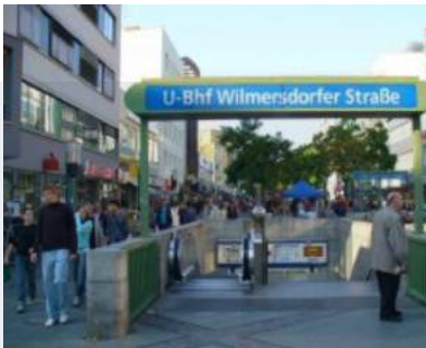
BERLIN - HOTEL

Projektart.....Sanierung Zimmer.....115 Fertigstellung.....2013 Volumen.....ca. 7,35 Mio. €